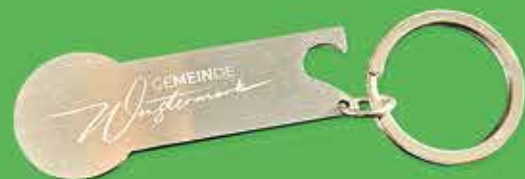
Schlüsselanhänger 2€ Einkaufswagenlöser mit Flaschenöffner

(Verkauf innerhalb der Öffnungszeiten des Bürgerbüros / Preise inkl. MwSt.)