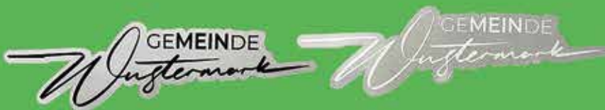
Aufkleber Schwarz o. Weiß 1€ auf transparenter Folie (z.B. für das Auto)