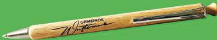
Kugelschreiber aus Holz 3€