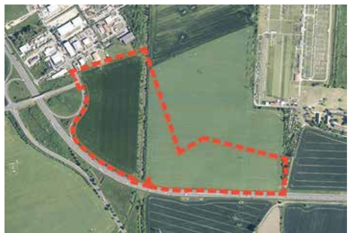
Lage des räumlichen Geltungsbereichs des Bebauungsplans Nr. W 49 „Rechenzentrum 1 Wustermark Nordwest“ (rote, gestrichelte Umgrenzung; Quelle Luftbild: GeoBasis-DE/LGB 2023)

Die Offenlage wird hiermit öffentlich bekannt gemacht.