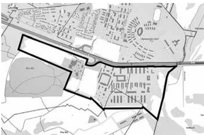
Abbildung 1 – Abgrenzung Geltungsbereich