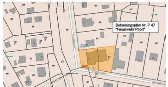
Ausschnitt aus dem Digitalen Orthophoto und der Webkarte mit dem Liegenschaftskataster (ALKIS) der Landesvermessung und Geobasisinformation Brandenburg, Stand 27.06.2022, mit der Darstellung des räumlichen Geltungsbereichs des B-Plans P 47 „Feuerwehr Priort“

Der nachfolgende Kartenausschnitt kennzeichnet die Lage und Ausdehnung des räumlichen Geltungsbereichs des Bebauungsplans Nr. P 47 „Feuerwehr Priort“ im Ortsteil Priort.