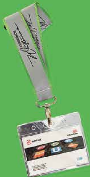
Schlüsselband 2€ reflektierend mit Sicherheitsverschluss und Fahrkartenhülle