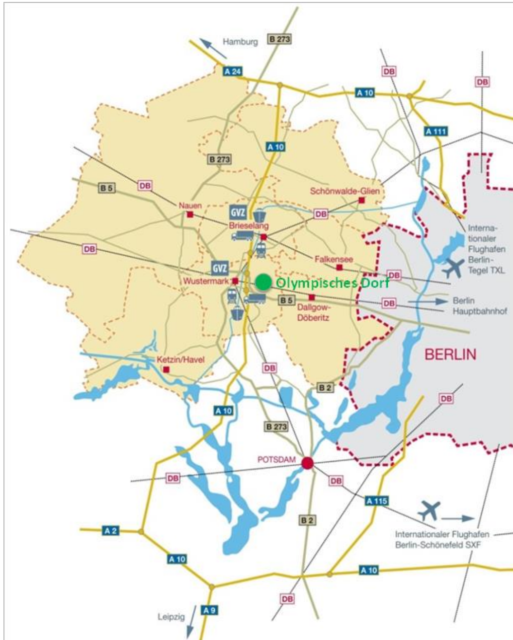
Abbildung 2: Großräumige Lage in der Metropolregion Berlin-Brandenburg; www.osthavelland.de

Siedlungsstruktur der Ortslage behutsam und zielgerichtet zu vervollständigen bzw. weiter zu entwickeln. Auch die Revitalisierung des Olympischen Dorfes und dessen Einbindung in die bestehende Siedlungsstruktur sind hierfür ein wesentlicher Bestandteil.