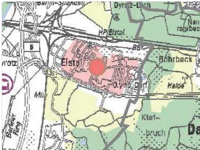
Abbildung 4: Auszug Regionalplan Havelland-Fläming 2020

Die Entwicklung der weiteren Bauabschnitte des Plangebietes steht unter dem Vorbehalt der Errichtung weiterer Einrichtungen der Daseinsvorsorge in Übereinstimmung mit regionalplanerischen Belangen.