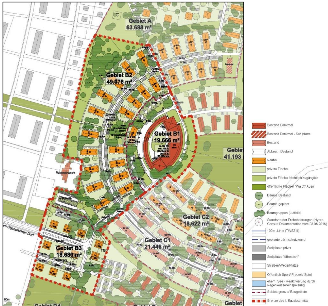
Abbildung 5: Städtebauliches Konzept, Ausschnitt 1.BA, Beschluss 27.11.2016

Wohneinheiten geplant. Die Erschließung wird, entsprechend des Gesamtkonzepts, über die Straße Zum Olympischen Dorf erfolgen.