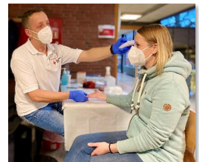
DRK-Blutspende unter Pandemiebedingungen. Hier: Messung des HB-Wertes vor der Blutentnahme; Foto: ©DRK-Blutspendedienst; Nutzung honorarfrei

Wer sich für das Blutspenden beim DRK interessiert, sollte unbedingt mal reinklicken. Außerdem ist eine Terminreservierung für alle DRK-Blutspende-Termine erforderlich. Sie kann unter https://terminreservierung.blutspende-nordost.de/ erfolgen oder auch über die kostenlose Hotline 0800 11 949 11. Die Vorab-Buchung von festen Spendezeiten dient dem reibungslosen Ablauf unter Einhaltung aller aktuell geltenden Hygiene- und Abstandsregeln.